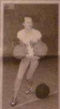
Ловкость и спортивную партию с партнерами показали по состязаниях и девушки.

С начала учебного года в гимназии прошли массовые соревнования по осен-