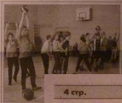
Все участники соревнований.

нему кроссу, состоялся день здоровья. И вот следующие мероприятия – месячник физической культуры. В рамках него прошел турнир по баскетболу для учащихся 7-х – 9-х классов, а также цикл спортивных праздников для учащихся 1-11 классов. В них принял участие более 130 гимназистов. Ребята бегали,